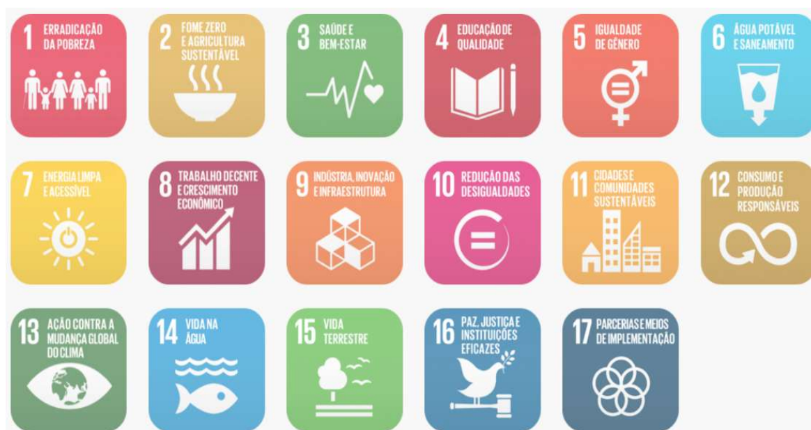
Figura 02: Objetivos de Desenvolvimento Sustentável

Em fortalecimento aos compromissos firmados pelo governo federal junto a ONU que fazem parte dos Objetivos de Desenvolvimento Sustentável – ODS, articulados através da agenda 2030, este projeto promove a utilização de estratégias para construção de edificações sustentáveis, como forma de garantir a sua resiliência e adaptabilidade em meio às mudanças climáticas. Sendo assim ele foi desenvolvido com a utilização de sistemas construtivos capazes de contribuir para a preservação e conservação do meio ambiente, diminuindo o uso e o esgotamento dos recursos naturais, a produção de resíduos e o consumo de energia.